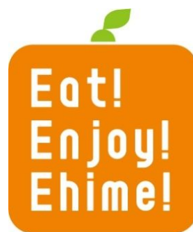
「えひめカフェ」プロジェクトロゴ

今回の『えひめカフェ』プロジェクトは、「Eat Enjoy Ehime」をテーマに情報感度の高い人々が集まる表参道エリアのカフェやヘアサロンにて、愛媛県の農林水産物を使ったオリジナルフードやドリンクを提供します。そして、展開カフェやヘアサロンの情報をまとめたマップや愛媛の柑橘と美容に関する情報を紹介したフリーペーパーを配布する等、表参道エリア一帯で愛媛県の農林水産物の情報を発信します。