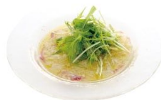
愛媛産 愛鯛のカルパッチョ