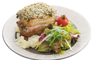
愛媛甘とろ豚の煮込み 香草パン粉焼き ( dining cafe HOME)