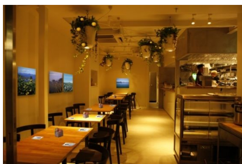
店舗内観イメージ