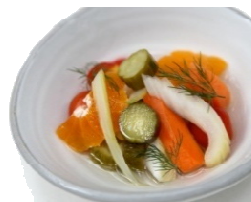
自家製ピクルス 愛媛みかんの香り